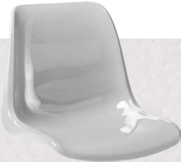
lichtgrau Light grey

OWI-Standardfarben OWI Standard Colours: