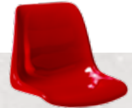
signalrot Signal red

OWI-Standardfarben OWI Standard Colours: